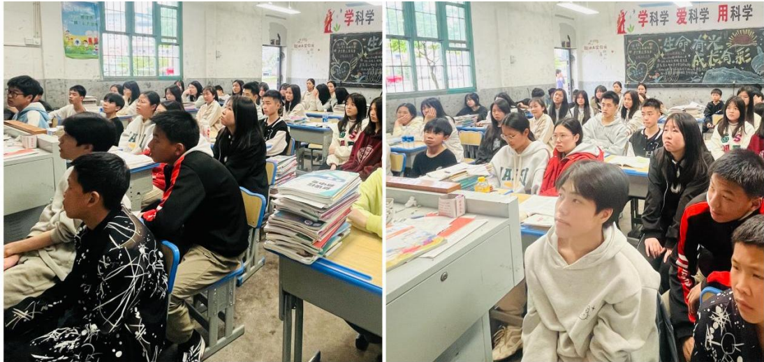
同学们在认真观看微电影“接纳不完美的自己”