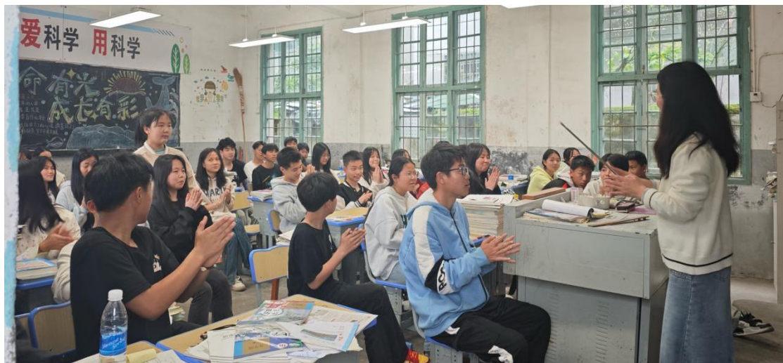
同学们在分享“微电影”心得体会