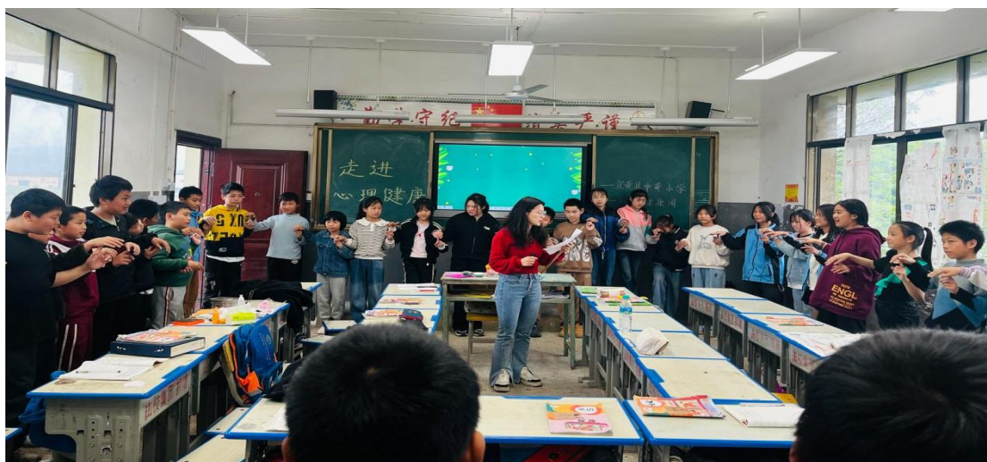
中黄小学5-6年级 “抓乌龟”热身游戏