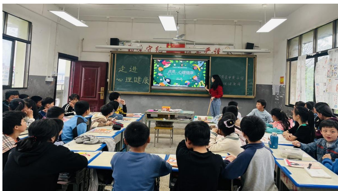
桃陂学校4-6年级讲座