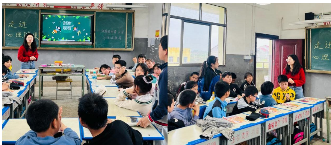
中黄5-6年级 讨论与分享