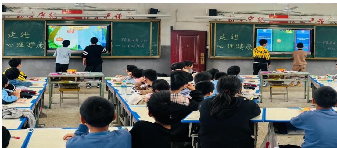
中黄小学5-6年级 回答问题大PK