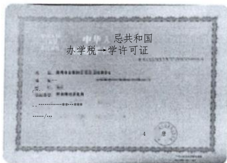
“民办学校办学许可证”纸质版或电子版